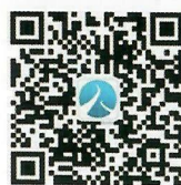
长沙市明阳山殡仪馆 公众号