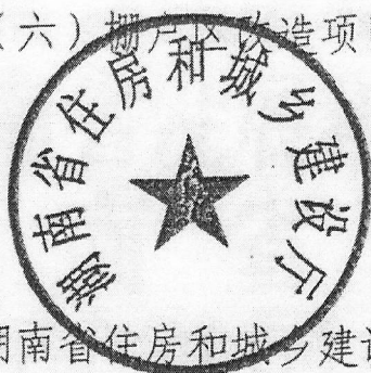
湖南省住房和城乡建设厅