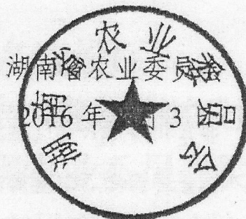
湖南省农业委员会 2016年3月