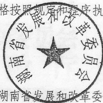
湖南省发展和改革委员会