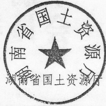
湖南省国土资源厅